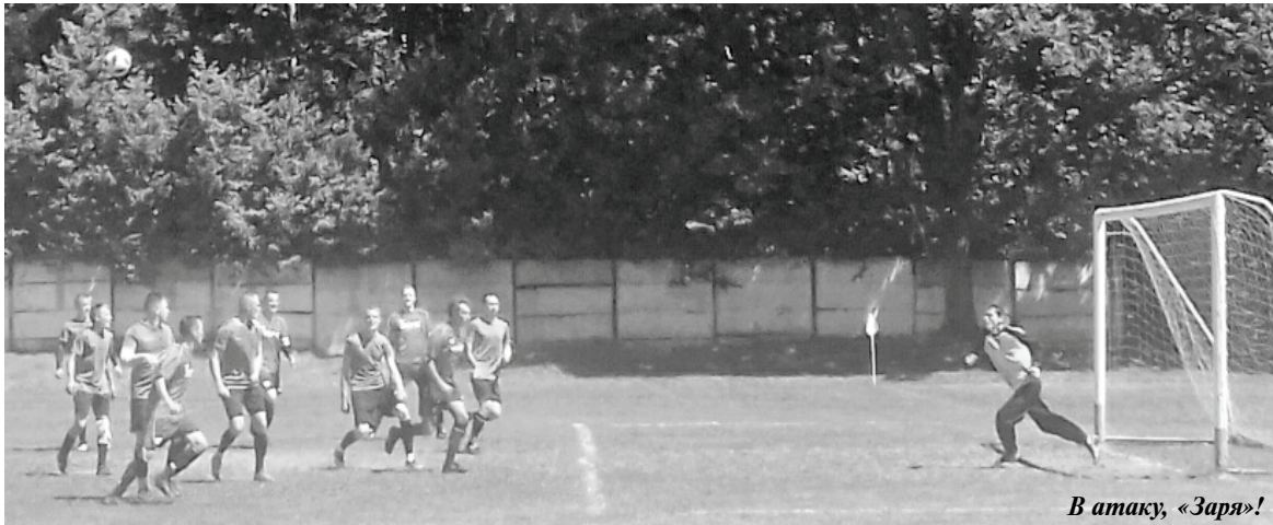
В атаку, «Заря»!